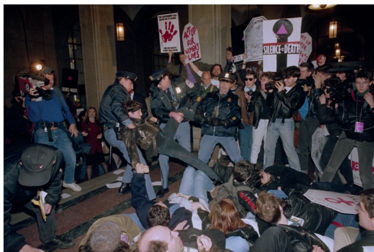
Albany Actie ACT UP, 23 maart 1990.

Door de grassrootsstructuur en geen rechten aan de beeldtaal te koppelen kunnen individuen in andere steden en landen ook eenvoudig een ACT UP-beweging starten. Zo worden vanaf 1989 ook bewegingen in onder andere Berlijn, Amsterdam en Parijs opgericht. Die eerste twee houden midden jaren '90 op te bestaan of vloeien over in andere verenigingen. De Amerikaanse en de Franse beweging zijn tot de dag van vandaag nog volop actief.