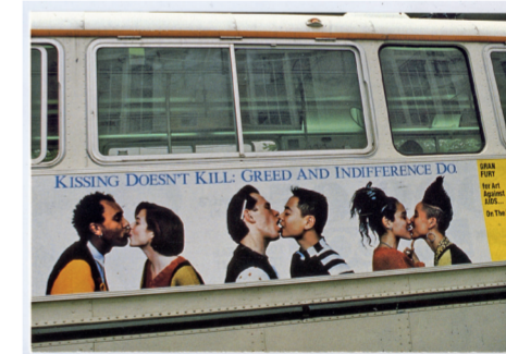
Gran Fury, Kissing Doesn't Kill, 1989.

rende en cynische lading met een knipoog naar de alledaagse aanwezigheid in de publieke ruimte. In 1987 nodigt William Olander, lid van de beweging en senior curator bij het New Museum, Gran Fury uit voor hun debuut in het museum, dat hun formatie als groep een impuls geeft. Let The Record Show... is te zien vanaf de straat en bestaat uit een neon-versie van het symbool en de slogan met daaronder een foto van het proces van Neurenberg – een langlopend proces